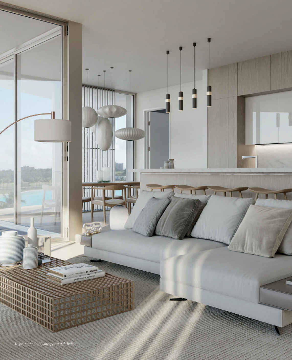
Representación Conceptual del Artista

Las paredes con ventanas del piso al techo permiten abundante luz natural en todas partes, iluminando los interiores de los condominios de Meyer Davis Studio con acabados de diseñador en una paleta suave y neutra.