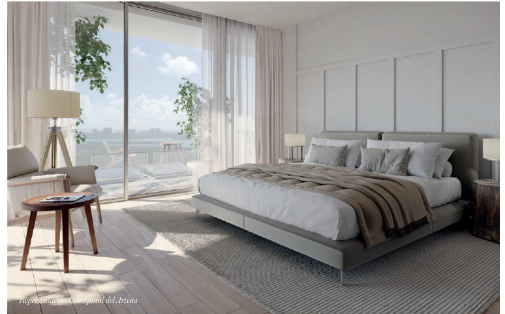
Representación Conceptual del Artista

Interiores elegantemente diseñados por Meyer Davis Studio con impresionantes vistas panorámicas del Océano Atlántico, Biscayne Bay, el Parque Estatal Oleta River, el horizonte de Miami y la Laguna SoLé de siete acres. Espaciosas plantas totalmente acabadas con techos de más de 9 pies de altura que se abren a una gran planta privada acabada, balcones envolventes con barandillas de cristal para una vida interior-exterior sin interrupciones.