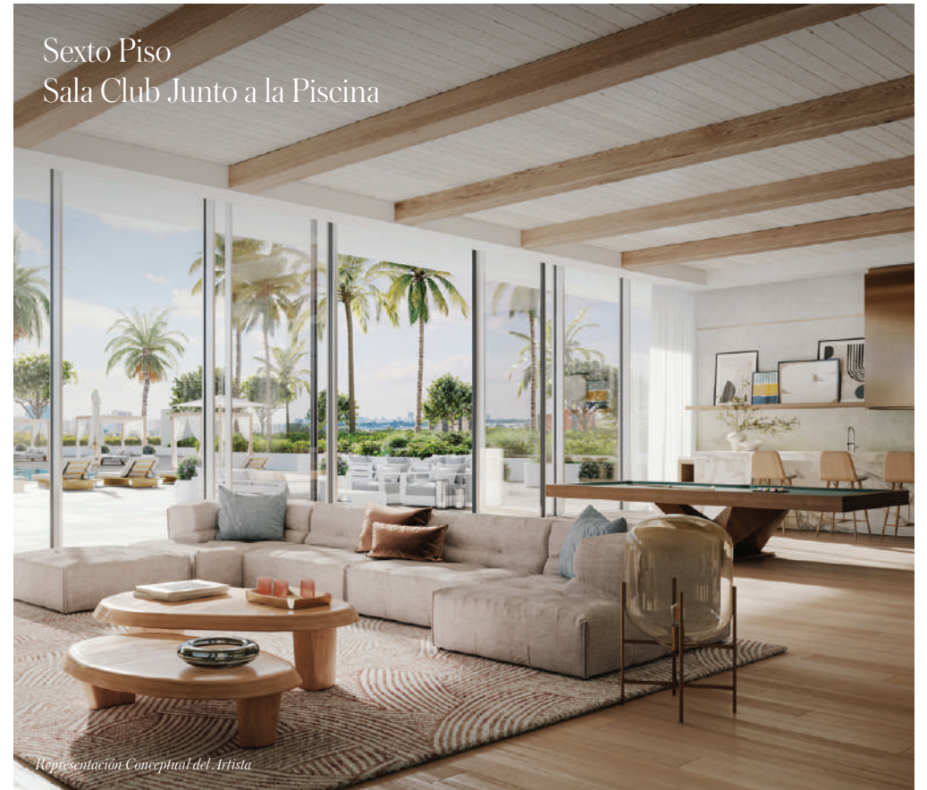
Sexto Piso Sala Club Junto a la Piscina